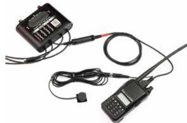
【本体価格】 ¥9,500 + 消費税 【品番】 NAV-EX-TP

ヘルメットやヘッドセットを装着中でも無線機との通話が可能。付属の防水 PTT スイッチを押している時に音声送信状態。