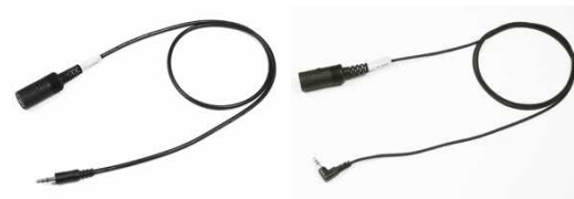
ステレオ φ 3.5mm

NAVIGON アンプに外部機器の音声（クラシックカーラリーでのカウントダウン音やタイムショット音等）を入力。