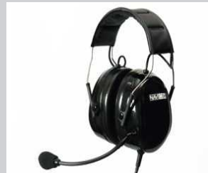
【本体価格】 ¥29,000 + 消費税 【品番】 NAV-H1

激しい振動や衝撃に強く、優れた遮音性とタフな耐久性、長時間使用でも快適な最軽量モデル。スピーカーは耳位置に合わせて、上下スライド調整可能。ヘッドバンドは頭を挟み込む力を軽減させるテンション調整可能。