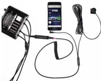
【本体価格】 ¥8,500 + 消費税 【品番】 NAV-EX-IR

ヘルメットやヘッドセットを装着中でも音声コントロールアプリ Siri により電話や操作が可能。付属の防水プッシュスイッチにより Siri 操作及び着信時の通話開始・終了が行えます。