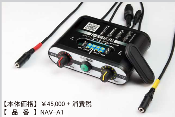
【本体価格】 ¥45,000 + 消費税 【品番】 NAV-A1