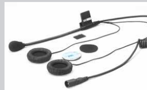
【本体価格】 ¥20,000 税別 【品番】 NAV-MS1

ヘルメットに安全、簡単かつ確実に固定でき、激しい振動や衝撃に強く適度な遮音性、耐久性を重視したモデル。